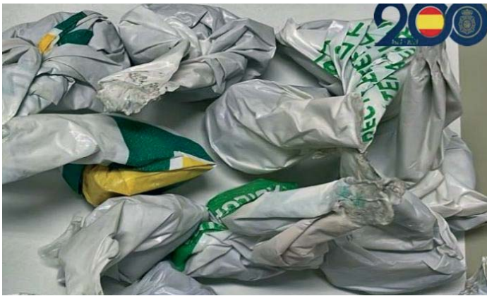
Droga incautada en Úbeda.