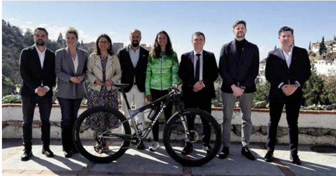
Presentación de la XV Andalucía Bike Race en Granada. ABR