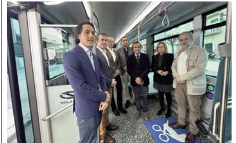
Visita a uno de los autobuses nuevos. ESPERANZA CALZADO

ESPERANZA CALZADO | El Ayuntamiento, de la mano de Alsa, ha puesto en servicio este jueves nuevos autobuses eléctricos con tecnología de cero emisiones. De momento, están cubriendo las líneas 1 y 21. La previsión es que a lo largo de este año se incorporen siete vehículos nuevos más a una flota de transporte urbano muy envejecida.