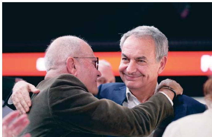
El expresidente José Luis Rodríguez Zapatero (d) saluda al expresidente de la Junta, Manuel Chaves.