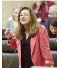
La consejera en el Parlamento.

“Saben que estamos trabajando, que nuestros técnicos