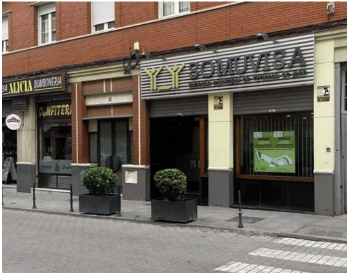
Oficinas de Somuvisa en la capital jiennense. ESPERANZA CALZADO

Ante este nuevo panorama, el próximo lunes, 24 de febrero, está convocada la Junta General de Accionistas de Somuvisa para adoptar el acuerdo de revertir y dejar sin efecto