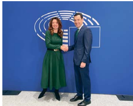
Juanma Moreno y Kata Tüttö, ayer tras ser elegidos.

porque es "mucho lo que está en juego en este mandato", y es fundamental "reforzar las democracias" ante las crecientes "voces antieuropeas" y las "máquinas de desinformación". "Necesitamos una Europa unida, estable y que tiene que tener muy bien definidos sus objetivos de presente y de futuro y firmeza a la hora de tomar decisiones", dijo Moreno.