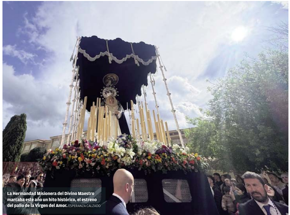
La Hermandad Misionera del Divino Maestro marcaba este año un hito histórico, el estreno del palio de la Virgen del Amor. ESPERANZA CALZADO

PRECIPITACIONES Divino Maestro y la Clemencia desafían a la lluvia, que les sorprende en mitad del recorrido, y el Silencio se queda sin estación de penitencia un año más