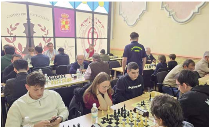
Participantes en el Abierto Universidad de Jaén de Ajedrez. UJA

Una de las novedades más destacadas de esta edición fue la retransmisión en directo de las partidas más emocionantes, permitiendo a aficionados y seguidores del ajedrez vivir la intensidad del