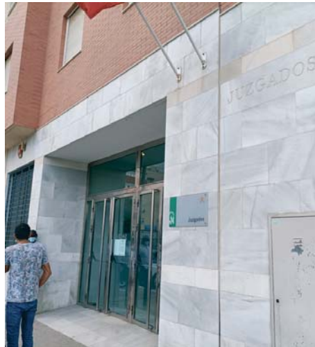
Juzgados de Roquetas de Mar (Almería).

En cuanto al tercer detenido, que únicamente contestó a las preguntas de su letrado, no reunía la cualificación profesional requerida para este tipo de intervenciones.