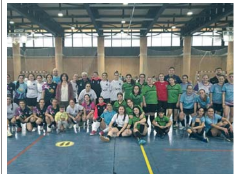
Participantes en el cuadrangular celebrado en Las Fuentezuelas.

En el aumento de la tradición del futsal ha influido el crecimiento exponencial del Jaén Paraíso Interior, campeón de tres Copas de España, y la puesta de largo del Olivo Arena, la infraestructura lograda con 24 millones de euros que ha dado aún más realce a Jaén en las esferas deportiva y cultural.