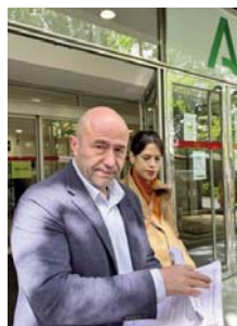
Olivares y Caravaca.

En relación a la línea de autobuses que la Junta le insta a que habilite, a fin de evitar el peligro de los traslados a pie