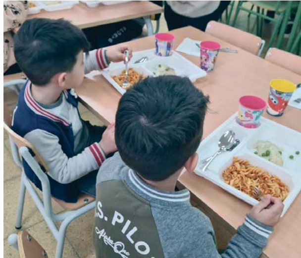
JUNTA DE EXTREMADURA

Las frituras que se elaboren en el día (que no procedan de productos precocinados) podrán servirse una vez a la semana como máximo, indicándose que para elaborar estas frituras se use preferentemente aceite de oliva o aceite de girasol alto oleico