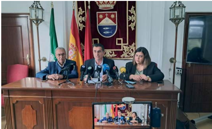
Rueda de prensa de los alcaldes de Barbate, Tarifa y Conil. AI

do que no se trata únicamente de un conflicto laboral, sino de “garantizar la continuidad y legalidad de un modelo pesquero sostenible que ha sido ejemplo en Europa” y ha defendido, tras conocer las reivindicaciones de los inspectores de pesca de primera mano, que “se atiendan sus demandas, para evitar mayores perjuicios al sector, ya que las demandas comenzaron en el mes de noviembre y la falta de negociación por parte de Gobierno ha provocado que se llegue a esta situación de huelga indefinida y a la incertidumbre actual”.