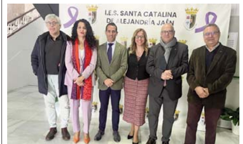
Actividad en el IES Santa Catalina de Alejandría. SUBDELEGACIÓN

La actuación se enmarca en el Seminario Hermanas Mirabal, un espacio formativo, dirigido a profesionales y a la ciudadanía, orientado a la erradicación de la violencia machista a través de la educación especializada, gestionada conjuntamente entre la Unidad de Violencia sobre la Mujer de la Subdelegación del Gobierno y el Centro Asociado de la UNED en Jaén Andrés de Vandelvira.