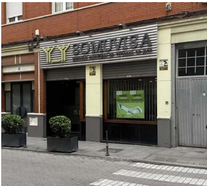
Oficinas de la Sociedad Municipal de la Vivienda.