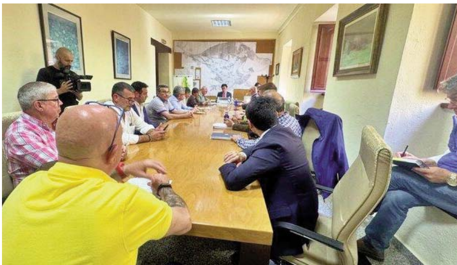
Encuentro de la comisión de Los Puentes en Urbanismo, en abril. FRAN CANO

El anterior encuentro se celebró el 15 de abril en la Gerencia de Urbanismo, en La Merced, y desde entonces los afectados no saben qué movimien-