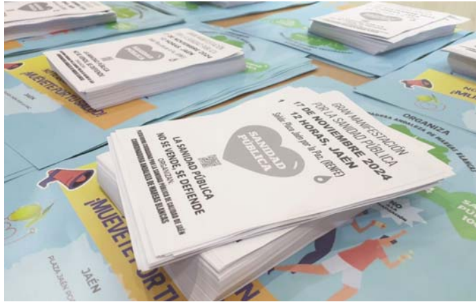
Octavillas de la protesta. PLATAFORMA POR LA SANIDAD PÚBLICA Y DE CALIDAD DE JAÉN

Avisan de que el tiempo medio de cita en Atención Pri-