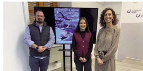
Jaén será el epicentro de la natación andaluza máster.

ANTONIO J. SOLER | Jaén vuelve a convertirse en el epicentro de la natación máster. La piscina de Las Fuentezuelas será el escenario del Campeonato de Andalucía de larga distancia que se celebrará durante el próximo fin de semana y en el que tomarán parte 127 nadadores y nadadoras de toda la región, incluidos los participante que llegarán a Jaén desde la ciudad autónoma de Ceuta. Será un fin de semana intenso de natación con un