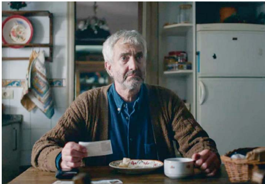
Imagen extraída del anuncio del Sorteo Extraordinario de la Lotería de Navidad de este año.

Sobre la posibilidad de que existan décimos dañados por la situación en la que han quedado algunas administraciones y casas, Huerta