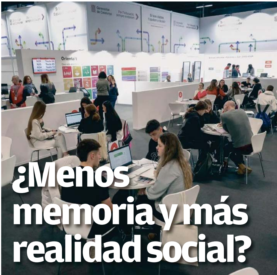
Varios jóvenes piden información sobre la oferta formativa en un stand del XXXII Saló de la Ensenya en la Fira de Barcelona.