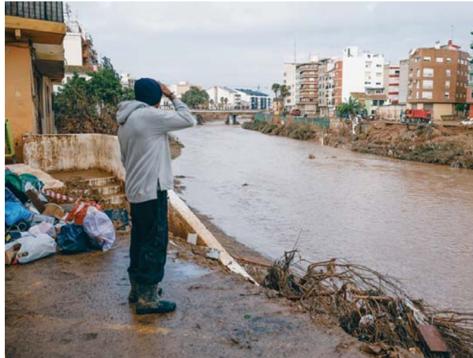
Un hombre observa el caudal del Barranco el Poyo este jueves en Paiporta (Valencia).

La alcaldesa de Paiporta, Maribel Albalat, explicó que desde el miércoles recomendaron a la población tomar