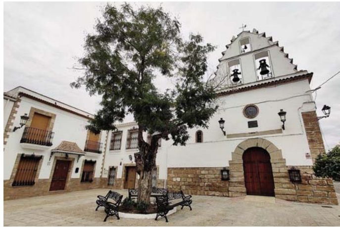
Iglesia de San José de Torreblascopedro.

La familia vive justo a la entrada del pueblo y el dolor es aun mayor, porque justo tenía 18 años y empezaba su vida como adulta. El IES Reyes de España, donde ella estudiaba Bachillerato, también ha expresado las condolencias por lo sucedido: "La comunidad educativa se encuentra de duelo por la pérdida de nues-