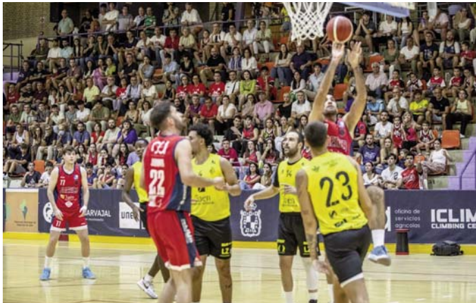
El derbi del año pasado tuvo una brutal afluencia de público.

Jaén CB llega al derbi con necesidad de ganar. Las tres derrotas en el inicio de la competición le han hecho daño a efectos de clasificación. Un arranque de competición