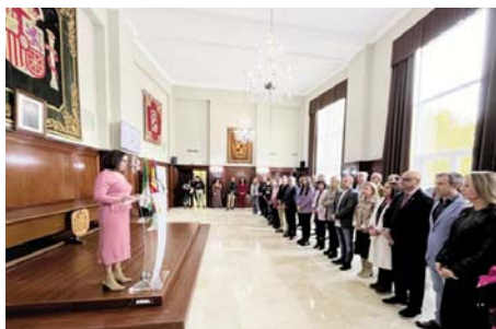
Rechazo a la violencia machista en la Subdelegación del Gobierno.

más de veinte entidades. Ha hecho un llamamiento a alzar la voz y no blanquear la violencia machista en un año especialmente trágico.