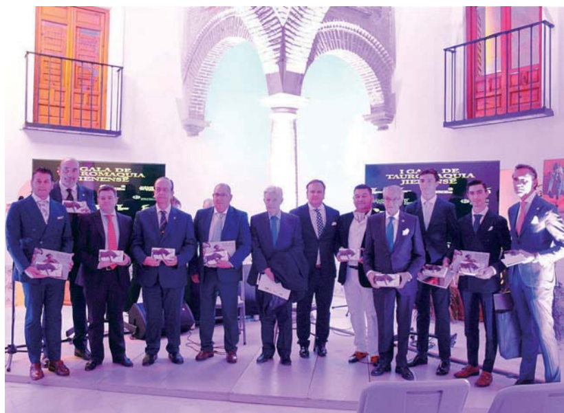
Foto de familia con los galardonados en la I Gala de la Tauromaquia Jiennense.

La plaza de toros de Jaén y su sociedad propietaria recibió el primer galardón de la noche. De sus manos surgió la Escuela de