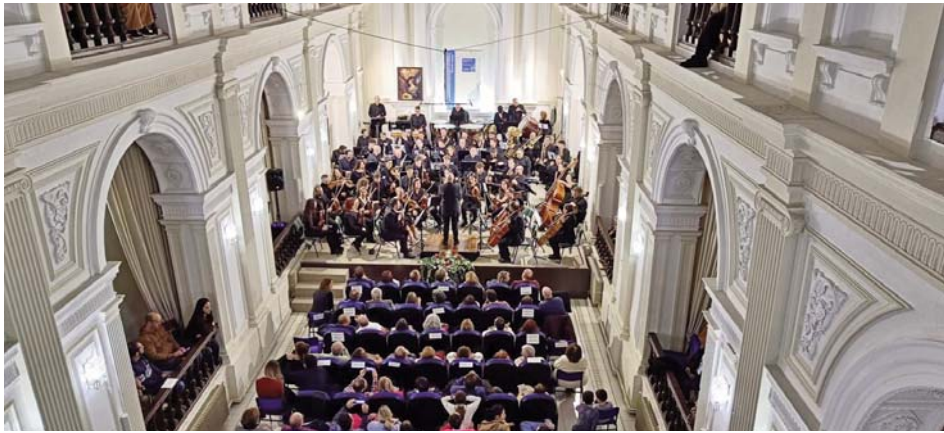
Concierto de la Orquesta Sinfónica Ramón Garay de Jaén.