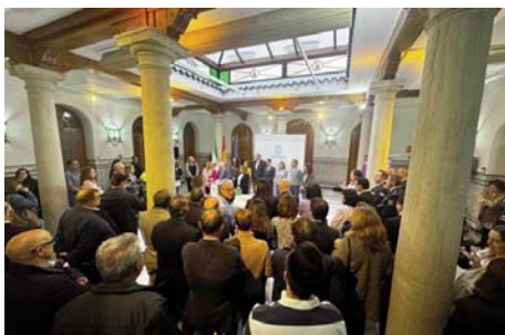
Conmemoración del 25N en la Junta de Andalucía.