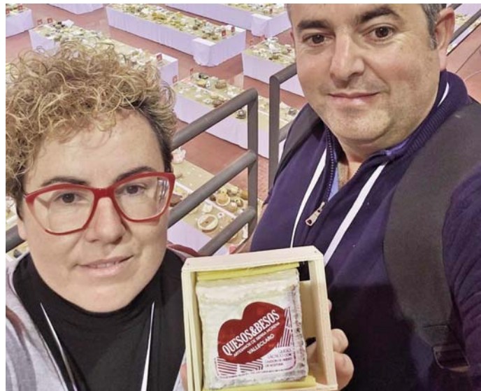
Los responsables de Quesos y Besos posan con su producto.