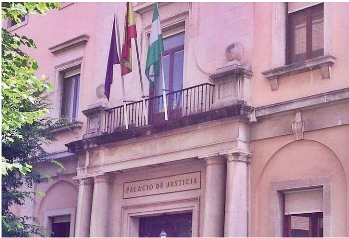
Imagen de la Audiencia de Jaén.

AGRESIÓN Los sentenciados han reconocido su participación en los hechos, se han declarado culpables y se han conformado con la pena propuesta