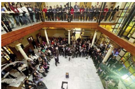
Acto en el Patronato de Asuntos Sociales.

Instituciones y organizaciones han celebrado actos de repulsa a lo largo y ancho de la provincia. En la Subdelegación del Gobierno en Jaén, en el patio del Patronato de Asuntos Sociales de la capital, en la sede de la Delegación de la Junta o en la lonja de la Diputación se ha visto el tradicional color morado de esta efeméride, que ayer se vistió de negro. Por la tarde tuvo lugar una performance organizada por la Comisión de Igualdad. Se encendieron velas, se tuvo un recuerdo para todas y cada una de las víctimas y se hizo un gesto de rechazo para con sus agresores. Ahí sí se dieron cita todas las administraciones, pese a la lluvia.