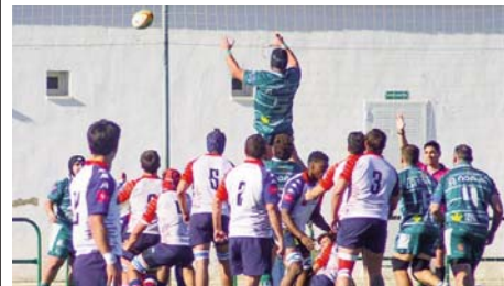
El equipo jiennense sucumbió ante el CR Liceo Francés.