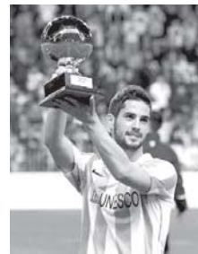
Isco Alarcón en el Málaga.

La última parada de la pretemporada será en el Paseo de Martiricos, un lugar donde