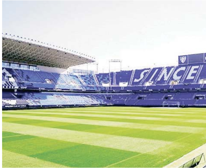
Estadio de La Rosaleda, en una imagen de archivo.

Uno de los aspectos más destacables es que se han analizado hasta 16 estudios técnicos, económicos y financieros para garantizar la viabilidad de la