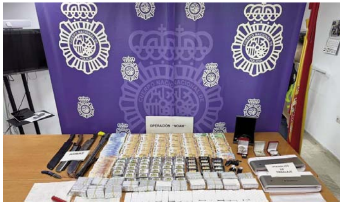
Imagen del material incautado en la operación policial. A.L.

La Policía considera responsables de la entrada clan-