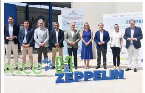
Imagen de la presentación del proyecto. VIVA CG