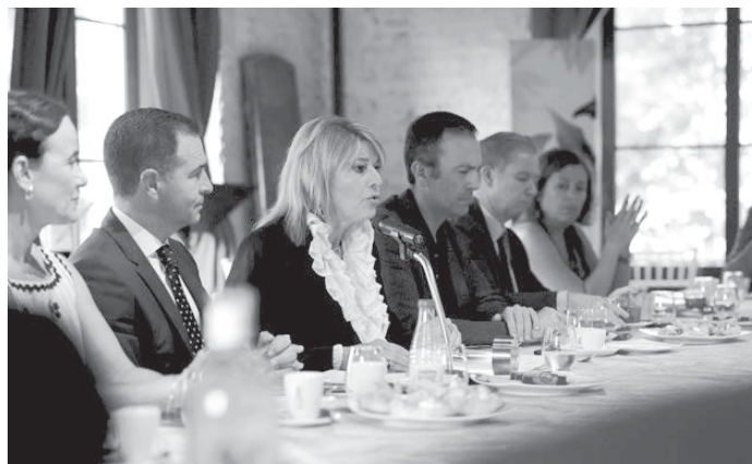
La alcaldesa de Huelva durante el desayuno informativo celebrado este jueves.