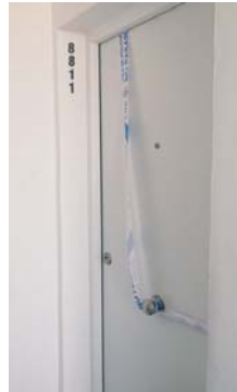
Puerta de la vivienda.

La comitiva judicial ha permanecido durante varias horas en el lugar de los hechos, junto a agentes adscritos a Policía Judicial y Científica, para recabar todas las evidencias posibles. Fuentes de la Subdelegación han indicado que no constan denuncias previas.