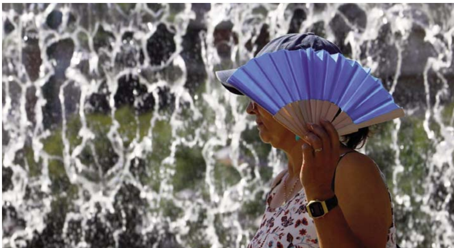
Imagen de una mujer refugiándose del calor.

La capital jiennense se sitúa así entre las ciudades andaluzas con mínimas más altas, solo superada por puntos como Osuna (26,4 grados a las 6:00) o las estaciones de