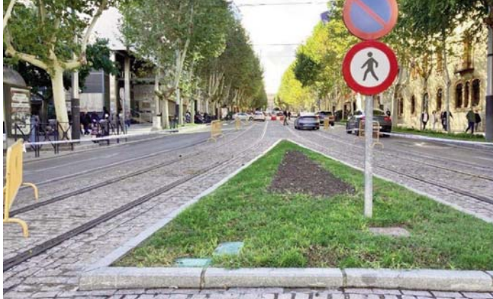
Imagen de archivo de las vías del tranvía.

Además, se procedió a la incautación del vehículo utilizado en la operación. Los cuatro detenidos están presuntamente implicados en el intercambio ilícito, y la Policía Nacional continúa investigando para esclarecer el ori-