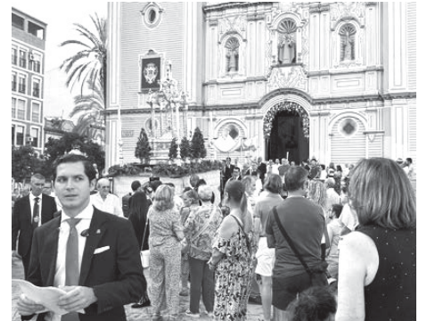
Procesión del Corpus Christi, este jueves en Huelva. VGPALACIOS

Por su parte, el domingo, a las 12.00 horas, el obispo de Huelva, monseñor Santiago Gómez, presidirá en la festividad del Corpus una misa estacional y posteriormente se realizará una procesión claustral por las naves de la Catedral de La Merced con el Santísimo Sacramento.