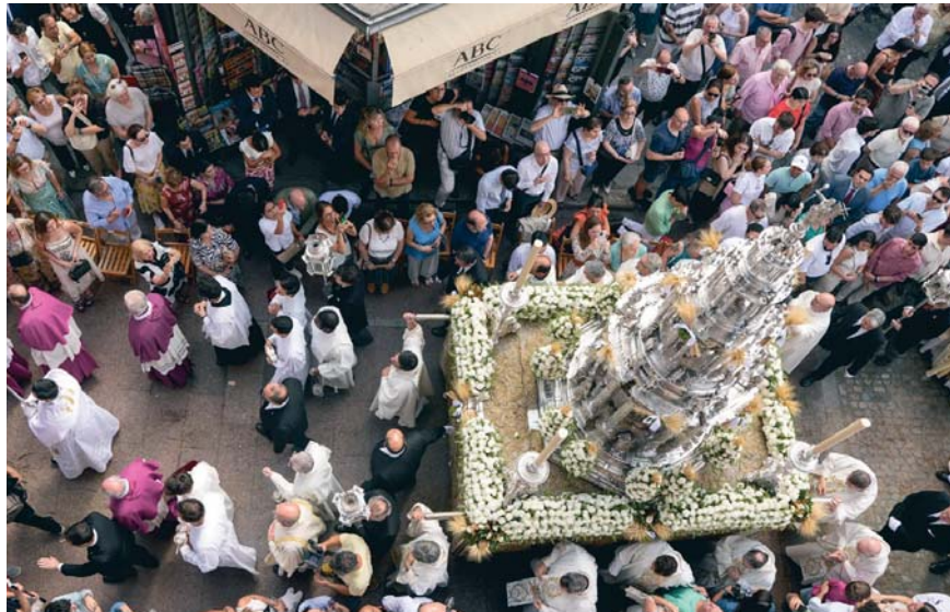
El paso de la Custodia entrando en la calle Sierpes tras pasar por las dos portadas de la Plaza de San Francisco.

En este 2025 se han introducido diversos cambios en la procesión del Corpus Christi, el más llamativo de ellos ha sido la vuelta de los costaleros a la Custodia. Se han estrenado por todo lo alto, con altas temperaturas en un paso que ya de por sí, es bastante pesado. Honor para ellos. Si bien es cierto que el resultado ha gustado por dar un toque más "cofra-