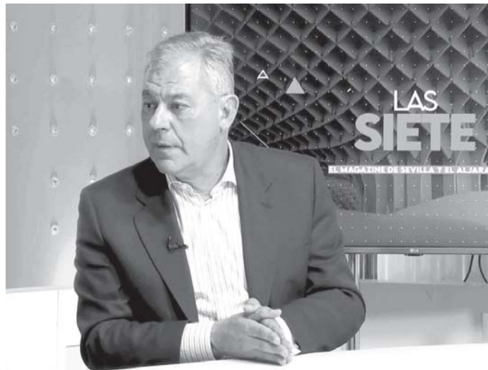
Un momento de la entrevista al alcalde de Sevilla, José Luis Sanz, en el magazine Las Siete.

Sobre el balance de sus dos años al frente del Ayuntamiento de Sevilla, ha asegurado que de lo que se siente más orgulloso es de "resolver uno de los problemas más importantes, que era el acceso a la vivienda", gracias al plan 2024-27 que permitirá crear 4.600 viviendas protegidas, más de 900 en construcción, apuntando que en Sevilla "claro que hay mucho suelo urbanizable".