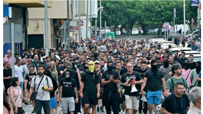
La manifestación de los trabajadores del sector del metal discurrió sin incidencias ayer.