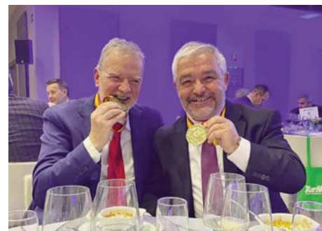
Responsables de las Agencias, en un evento anterior.

El evento está respaldado por La Confederación Española de Agencias de Viajes, a Federación Andaluza de Agencias de Viajes, la Junta de Andalucía, el Patronato de