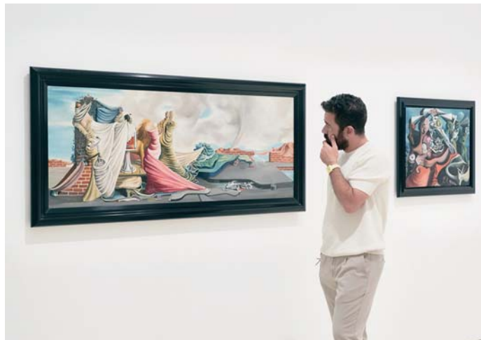
Exposición de Oscar Domínguez en el Museo Picasso Málaga.