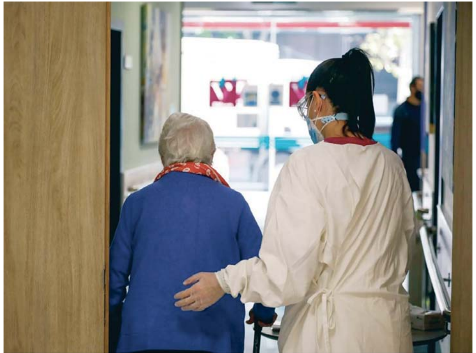
Imagen de archivo de una trabajadora de una residencia de mayores mientras ayuda a una residente.

"Cuando el Ministerio rebaja la cifra de desatención, la lista de espera, a 182.532 personas, se refiere exclusivamente a aquellas con las que el Ministerio y los Gobiernos Autonómicos no están cumpliendo la Ley"