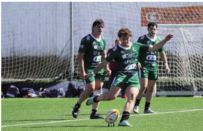
Partido del Jaén Rugby de esta temporada. ÓSCAR RODRÍGUEZ

El rival del Jaén Rugby lleva una racha más irregular, pues ha sumado sólo 13 puntos en la segunda vuelta y está en sexta posición con 26. Los jiennenses también quieren resarcirse de la derrota que sufrieron en el partido de la primera vuelta, que fue el últi-