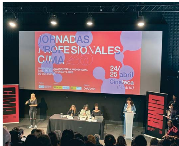
Presentación del informe de la Asociación de Mujeres Cineastas y de Medios Audiovisuales.

Por otro lado, advierten de que las mujeres jóvenes sufren doble vulneración porque se las ve como "presas". Así, "se ven obligadas a hacer cosas" que no quieren para poder tener un desarrollo co-