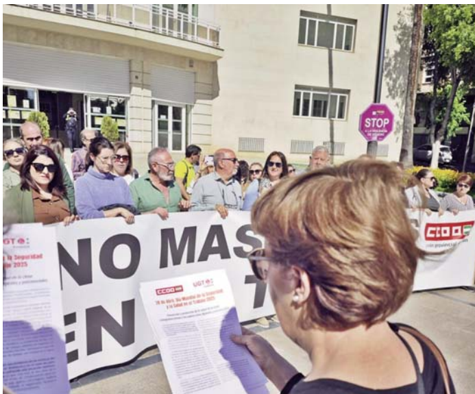
Concentración contra la siniestralidad laboral. UGT

Posteriormente, se ha guardado un minuto de silencio para conmemorar a las personas trabajadoras fallecidas en accidente laboral, en especial al trabajador fallecido el pasado miércoles, por una ca-