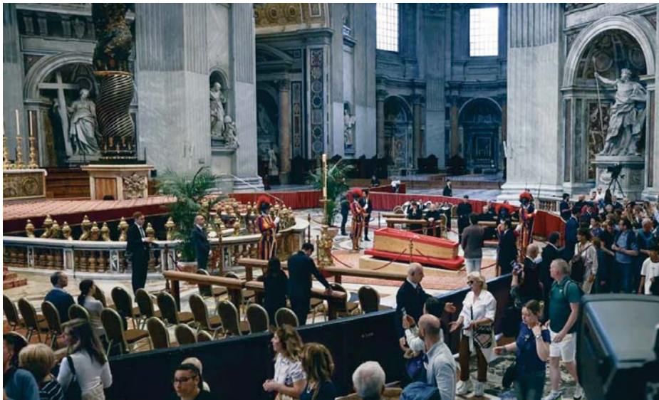
El público hace fila para presentar sus respetos al papa Francisco mientras yace en la capilla ardiente en la Basílica de San Pedro.