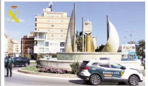
Agentes de la Guardia Civil en El Ejido.

La Guardia Civil del Equipo de Policía Judicial de El Ejido inició una investigación tras la denuncia y logró identificar al presunto autor, que fue reconocido por la víctima en un reconocimiento fotográfico, y con las pruebas reunidas los agentes procedieron a su detención.