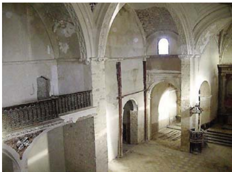
Iglesia de Santo Domingo.

En todo caso, ha anunciado que “el próximo día 5 de mayo las obras comenzarán, haya material allí o no haya material allí”. “Ya tenemos las llaves, ya tenemos la autorización, hemos dado el plazo