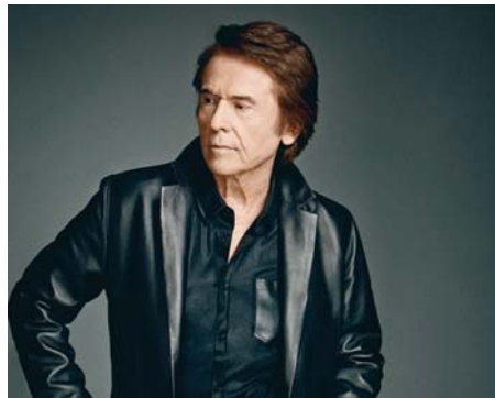
El cantante Raphael en una imagen de archivo.

La gira tendrá lugar durante los meses de junio, dos fechas en julio (Marbella y Chiclana de la Frontera), el mes de septiembre, octubre, noviembre y diciembre y sus entradas estarán disponibles a partir del próximo 29 de abril. Además, el último concierto será el 30