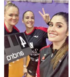
Celebración del Hujase. VIVA JAÉN

El tercer punto clave de la jornada llegó nuevamente de la mano de Haponova, quien en su segundo partido domi-