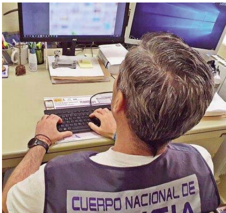
Un agente de la Policía Nacional.

Los agentes localizaron una página que servía como un repositorio de grabaciones de explotación sexual infantil, en continuo crecimiento por aporte de los propios usuarios. Tenía casi dos millones de suscriptores y 91.000 videos, cantidad que aumentaba a razón de