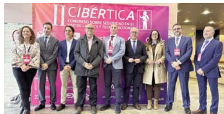
Autoridades en la segunda edición de Cibértica. SUBDELEGACIÓN