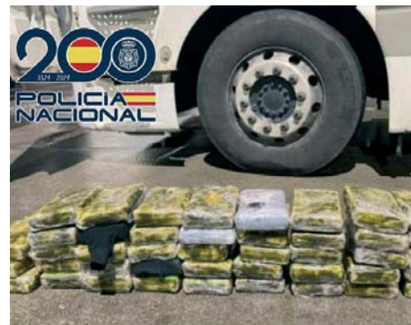
Operación policial.

Con estos datos, se estableció un control en una gasolinera situada en El Molar, donde el transportista, junto a los conductores de los otros dos vehículos que lo acompañaba, realizaba su descanso obligatorio. Ante estos hechos, fueron detenidos los tres responsables del transporte. Al mismo tiempo, en las naves donde se ocultó la sustancia fue detenido el guardés de la empresa.