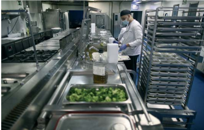
Los restaurantes deberán facilitar envases a sus clientes para que se lleven las sobras.

La norma consta de un total de 23 artículos. Promueve la donación de alimentos sobrantes en el sector de la distribución, obliga a los establecimientos de más de 1.300 metros cuadrados a disponer