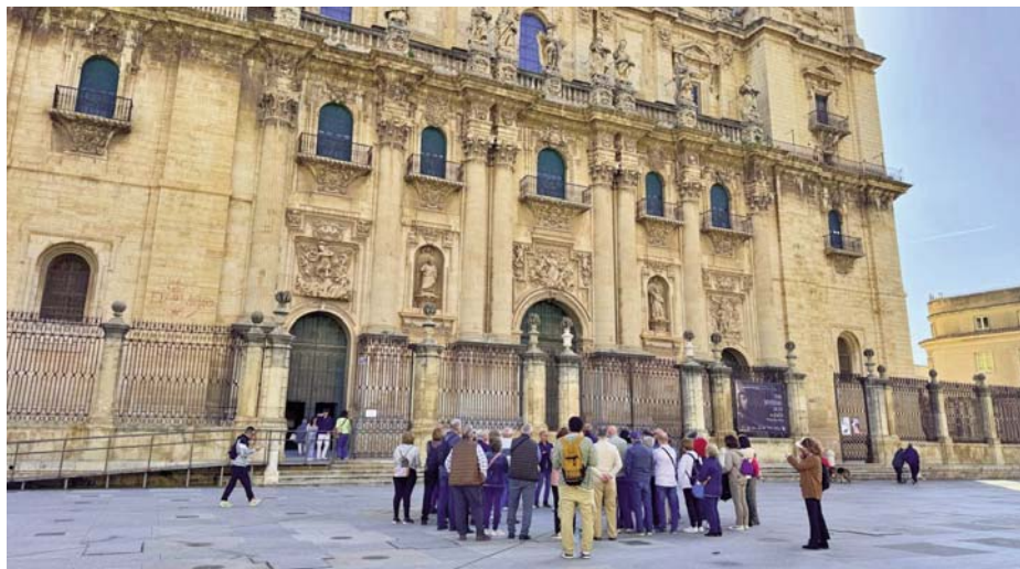
Turistas en la Catedral de Jaén.

El informe también destaca la elevada implicación de la ciudadanía con la fiesta cristiana, pues el 79% de los jiennenses tiene previsto participar en los actos. En este senti-