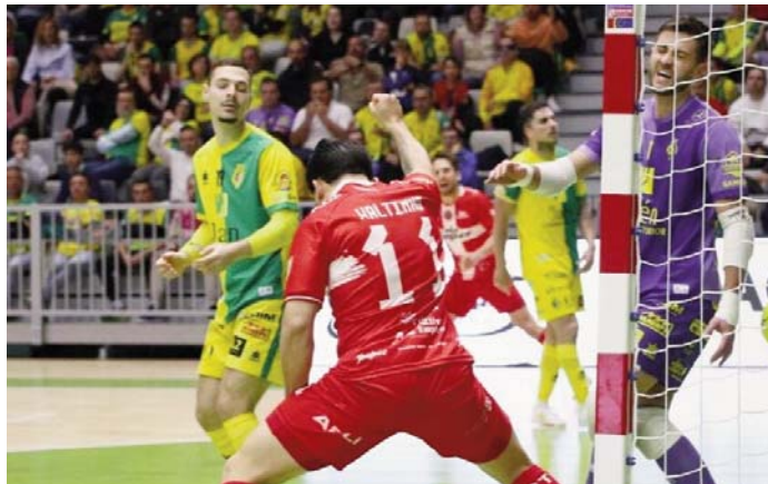
Duelo entre el Jaén Paraíso Interior y Jimbee Cartagena. JIMBEE CARTAGENA

Fue tal la adversidad para el Olivo Mecánico que llegó a ir 1-4 por debajo antes de que la media hora. Y, por desgracia para los intereses de Jaén, faltó también acierto en los metros finales. “La estadística no sirve de nada, y encima nos han hecho goles sin tener esa