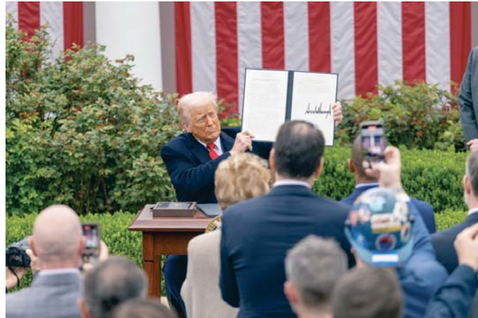
Donald Trump muestra a los asistentes su firma en los decretos gubernamentales.

A su vez, Trump cuantificó en 6 billones de dólares (5,525 billones de euros) las inversio-