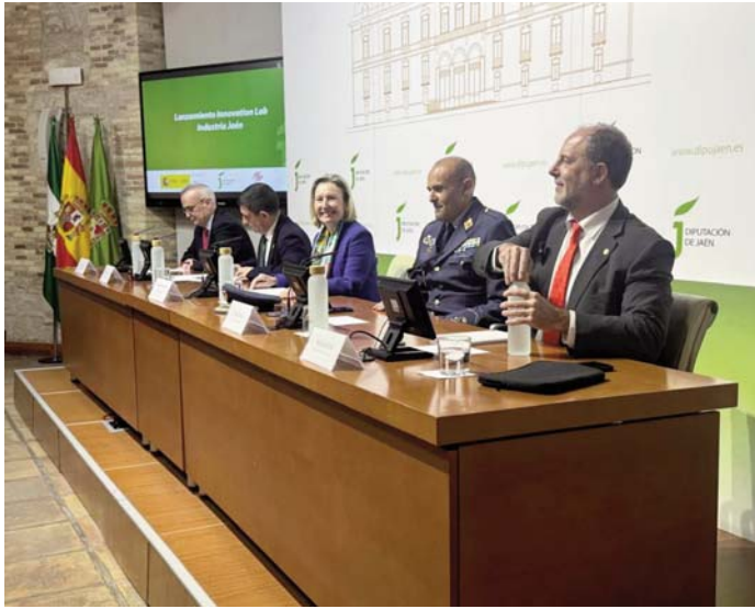
Presentación del proyecto Innovation Lab Industria Jaén. ESPERANZA CALZADO

Así, se ha dado a conocer el Cetedex Innovation Lab, que tiene dos objetivos fundamentales. El primero, continuar atrayendo empresas a Jaén, que sean innovadoras, que apuesten por la tecnología y que sean empresas líder,